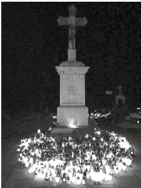
Może w tym roku pomyślisz o duchowym darze - nowennie mszalnej za dusze pokutujące w czyścicu albo gregoriance.

Duchowe pouczenie pozostawiła w swoich pismach Natuzza Etolo, włoska mistyczka i stygmatyczka, której proces beatyfikacyjny trwa od 2014 roku. Dziewczyne nawiedzali zmarli, którzy dzielili się z nią swoimi przeżyciami. Raz spotkała człowieka z Paravati, który niedawno zmarł. - Jak dobrze wyglądasz - powiedziała mu. - Widzisz mnie takiego, ale w rzeczywistości cierpię, mam usta pełne ognia, gdyż zasłużyłem na taką karę. Zbyt oczerniałem innych za życia - odparł. Natuzza